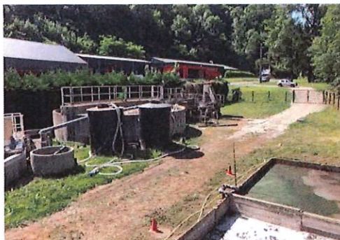
Tout un pôle économique est dépendant de la station d'épuration.